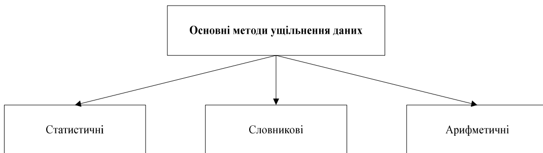
Рисунок 1 – Основні методи ущільнення даних

Арифметичне кодування, подібно до статистичних методів, використовує як основу технології ущільнення, імовірність появи символу у файлі, однак сам процес арифметичного кодування має принципові відмінності. У результаті арифметичного кодування символівна послідовність (рядок) замінюється дійсним числом більше нуля і менше одиниці [4].