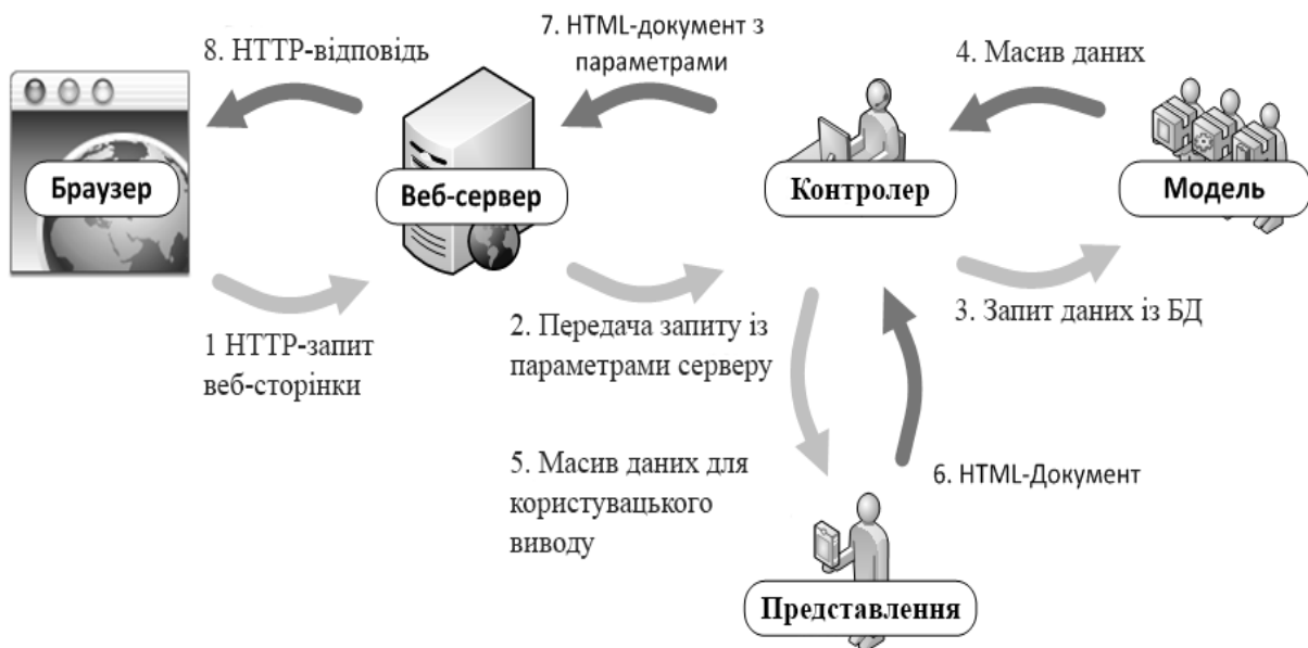
Рисунок 2 – MVC структура системи

При проектуванні системи використовувався MVC-патерн. Принцип роботи системи із застосуванням цього патерна зображений на рисунку 2.