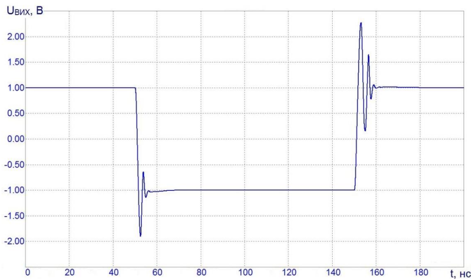
Рисунок 3 – Перехідна характеристика БН

Динамічні властивості БН можна оцінити на прикладі ядра схеми №1, перехідну характеристику якої зображено на рис. 3. При цьому слід відзначити досить високу швидкість наростання вхідної напруги \approx 1800 - 2000 В/мкс.