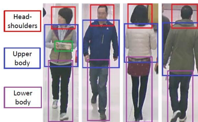
Рисунок 5 – Приклад атрибутів з наборів даних RAP

Друга версія набору даних RAP (RAPv2) призначена як для задачі пошуку людей, так і для розпізнавання атрибутів людини у реальних сценаріях спостереження. Набір даних було зібрано в приміщенні, у торговому центрі, і він містить 84 928 зображень (2589 особи) з 25 різних сцен. Для збору набору даних використовувались камери високої роздільної здатності ( 1280 \times 720 ), а роздільна здатність людських силуетів варіюється від 33 \times 81 до 415 \times 583 пікселів. Атрибути версії RAP v2 такі самі, як і у версії RAP v1 (72 атрибути, інформація про оклюзії, точку зору та частини тіла). Приклад атрибутів з наборів даних RAP представлені на рис. 5.