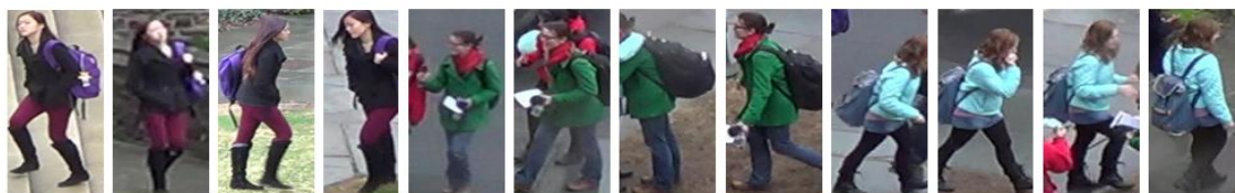
Рисунок 1 – Приклади різних поз пішохода з точок зору різних камер

Проблема просторового зміщення людини відносно камери є однією з ключових проблем при повторній ідентифікації особи. На рис. 1 зображено приклади зображень у яких пішохід знаходиться у різних позах з точок зору різних камер [2].