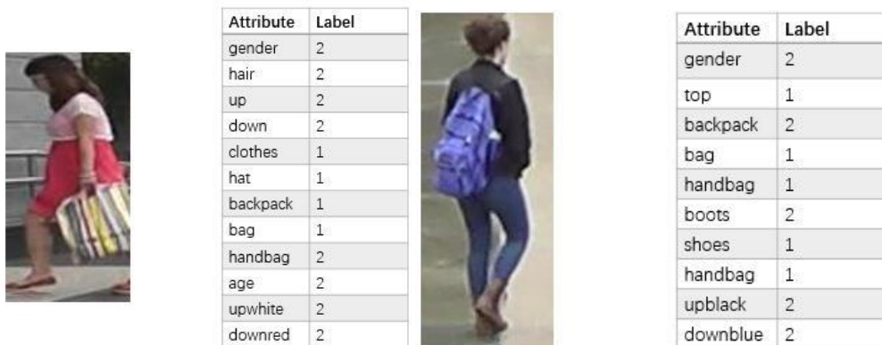
Рисунок 3 – Приклад атрибутів для наборів даних (a) Market-1501 та (b) Duke Attribute

Набір даних Duke Attribute. Набір даних DukeMTMC-reid був зібраний в кампусі університету Дюка і містить понад 14 годин відеопослідовностей, зібраних з 8 камер, розташованих таким чином, що фіксувати сцени з натовпом. Головною метою цього набору даних є дослідження задач повторної ідентифікації особи та відстеження особи за допомогою декількох камер. Крім цього підмножина набору даних DukeMTMC-reid - Duke Attribute була анотована людськими атрибутами. Атрибути представлені для кожної особи, і в цілому у наборі присутні 1404 анотовані особи (702 у тренувальному наборі, 702 у тестувальному наборі). Набір даних Duke Attribute містить 36411 зображень (16522 – тренувальних, 19889 – тестувальних). Анотація особи містять 23 атрибути, які стосуються статі (чоловіча, жіноча), аксесуарів: присутність капелюха (так, ні), присутність рюкзака (так, ні), присутність сумочки (так, ні), присутність інших типів сумок (так, ні); стиль одягу: тип взуття (черевики, інше взуття), колір взуття (темний, яскравий), довжина верхнього одягу (довга, коротка), 8 кольорів одягу верхньої частини тіла (чорний, білий, червоний, фіолетовий, сірий, синій, зелений, коричневий) та 7 кольорів одягу нижньої частини тіла (чорний, білий, червоний, сірий, синій, зелений, коричневий). На рис. 3 наведено приклад атрибутів для наборів даних Market-1501 Attribute та Duke Attribute.