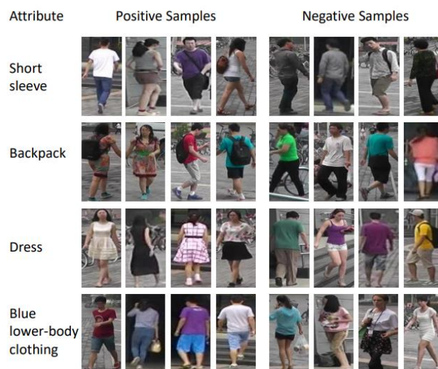
Рисунок 2 – Позитивні та негативні приклади атрибутів «короткий рукав», «рюкзак», «сукня», «синій одяг на нижній частині тіла» набору даних Market-1501

Набір даних Market-1501 Attribute. Market-1501 Attribute – це версія набору даних Market-1501, доповнена анотацією з 27 людськими атрибутами. Початковий набір Market-1501 призначений для дослідження задач повторної ідентифікації осіб. Набір був зібраний на вулиці перед супермаркетом за допомогою 6 камер (5 камер високої роздільної здатності та одна низької роздільної здатності). Атрибути представлені для кожної особи, і в цілому у наборі присутня 1501 анотована особа (751 у тренувальному наборі, 750 у тестувальному наборі). Загалом набір даних містить 32 668 зображень (12937 – тренувальних, 19733 – тестувальних). Атрибути в наборі Market-1501 Attribute, включають демографічну інформацію (стать та вік), інформацію про аксесуари (наявність капелюха, рюкзака, сумки), зовнішній вигляд (довжина волосся) та тип одягу та колір (довжина рукава, довжина одяг нижньої частини тіла, тип одягу нижньої частини тіла, 8 кольорів одягу верхньої частини тіла, 9 кольорів одягу нижньої частини тіла). Позитивні та негативні приклади деяких репрезентативних атрибутів набору даних Market-1501 показано на рис. 2.