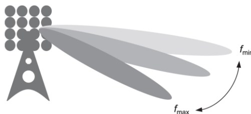
Рисунок 1 – Відхилення променя у ТГц-діапазоні

Дуже широка смуга пропускання, доступна на частотах ТГц, пов'язана зі специфічними проблемами. Потужність теплового шуму лінійно пропорційна робочій смузі пропускання, що призводить до дуже низького співвідношення сигнал/шум навіть на середніх відстанях Tx-Rx [4]. Широкосмугові радіочастотні схеми дорожчі і потенційно розсіюють більше енергії, що призводить до ще нижчої енергоефективності терагерцевих трансиверів [5]. Структура решітки з антенних ґраток (AoSA) ТГц-трансиверів поряд з дуже широкою смугою пропускання призводить до явища відхилення або розщеплення променя [6]. Це виникає через необхідність підтримувати прийнятну апертуру антени. Розміри антеної панелі не можуть лінійно зменшуватися зі змінюючою смугою частот, тоді як тривалість імпульсів скорочується в міру збільшення доступної смуги пропускання. В результаті різні антенні елементи (що належать або до однієї, або до різних антенних ґраток) володіють різницею в часі проходження дистанції, що співрозмірна з тривалістю імпульсу або більшу за неї. Ця різниця в часі призведе до того, що промені в робочих частинах смуги пропускання будуть спрямовані в різних напрямках, як показано на рис. 1. Це явище відхилення призводить до того, що надзвичайно вузькі передавальні та приймальні промені поширюються у різних (і небажаних) напрямках. Можливим рішенням цього явища є використання попереднього кодування із затримкою [7].